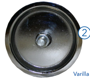
Varilla Con Lata Gruesa