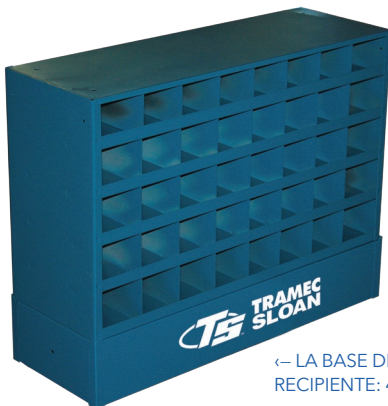
← LA BASE DEL RECIPIENTE: 424306