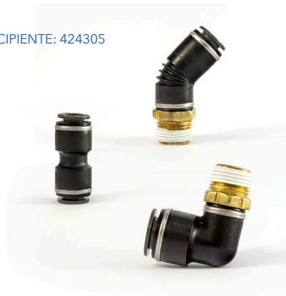
← RECIPIENTE: 424305