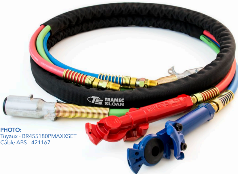
PHOTO: Tuyaux - BR455180PMAXXSET Câble ABS - 421167

Le nouveau MAXXWrap de Tramec Sloan offre un moyen durable de rassembler vos tuyaux d'air et câbles électriques. Fait de nylon balistique tissé serré, le MAXXWrap est flexible, repousse les liquides et empêche tous dommages causés par l'emmêlement des câbles, l'abrasion, l'essence, les produits chimiques, le brouillard salin, etc.